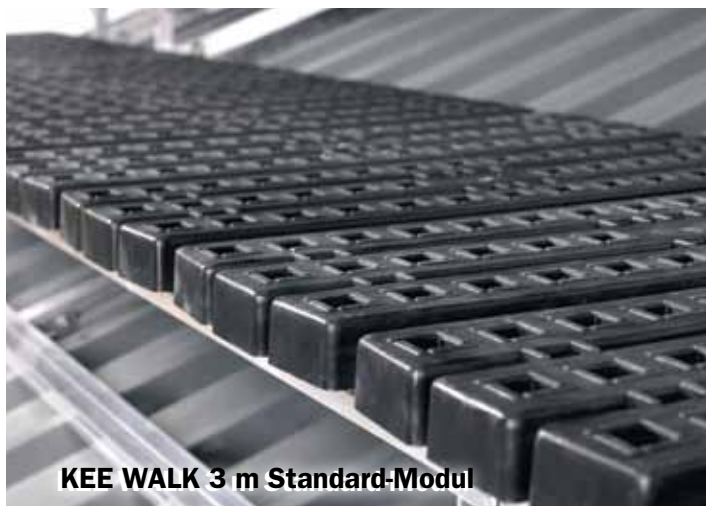
KEE WALK 3 m Standard-Modul

Die Rutschhemmung des Laufstegs ist für die Sicherheit der Personen von entscheidender Bedeutung. Gemäß dem Fachausschuss Bauliche Einrichtungen (FABE) der Deutschen Gesetzlichen Unfallversicherung (DGUV) ist für Bodenbeläge mit unterschiedlichen Betriebsbedingungen (z. B.: Nässe) mindestens ein Reibungskoeffizient von 0,45\mu , gemessen nach DIN 51131, erforderlich. KEE WALK erreicht sowohl im nassen Zustand mit 0,75\mu als auch im trockenen Zustand mit 0,78\mu fast den doppelten Wert.