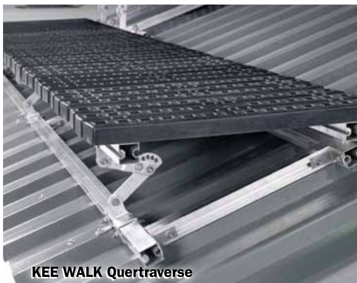
KEE WALK Quertraverse

Mit einem Gewicht von nur 24 kg können sie leicht verlegt werden. Die Verbindung der Module erfolgt mit einem 100 mm langen, geraden Verbinder, der an den Trägern befestigt wird.