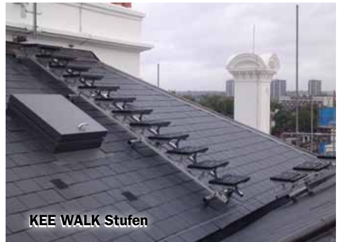
KEE WALK Stufen

Alle Trittplächen haben die folgenden Abmessungen: 625 mm breit, 225 mm tief und 35 mm stark.