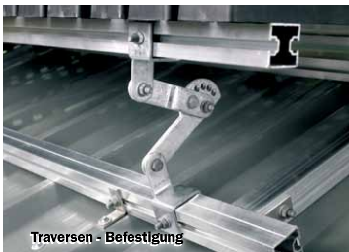
Traversen - Befestigung

Auch die Stufen können dank der Gelenke durch das Versetzen des Bolzens entsprechend der Dachneigung horizontal ausgerichtet werden.